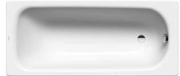
SANIFORM PLUS 3751,180x80cm Značka: Kaldewei Kód zboží: KW3751