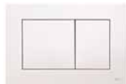
TECEnow plastové ovládací tlačítko bílé - tenký profil tlačítka Značka: Tece Kód zboží: 9.240.400