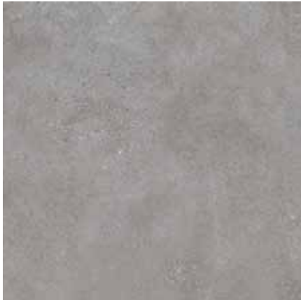
BETONICO šedá 60x60 rekt. Značka: Rako Kód zboží: DAK63791.1