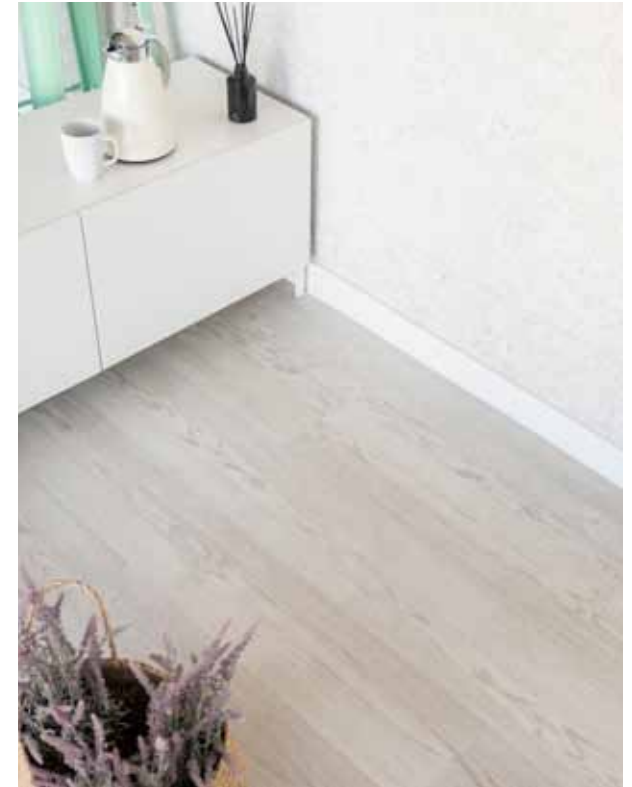
9583 Cloudy River Oak Plovoucí vinilová podlaha