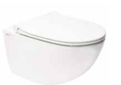
Inf závěsné WC rim-ex 54 cm vč.sedát Značka: SAT Kód zboží: SATINF011RREXP