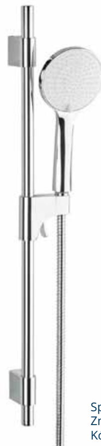
Sprchový set chrom 70cm Značka: SAT Kód zboží: SATSS33