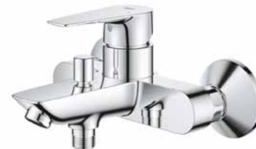
PRO Edge páková vanová nástěnná bat Značka: Grohe Kód zboží: G23604001