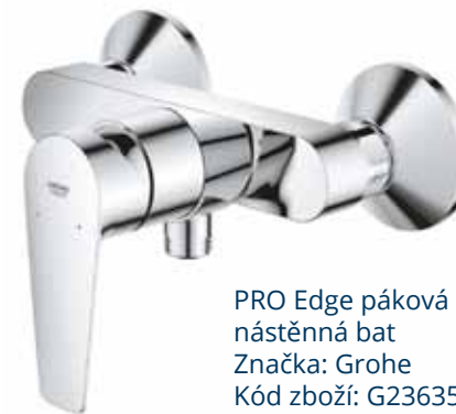
PRO Edge páková sprchová nástěnná bat Značka: Grohe Kód zboží: G23635001