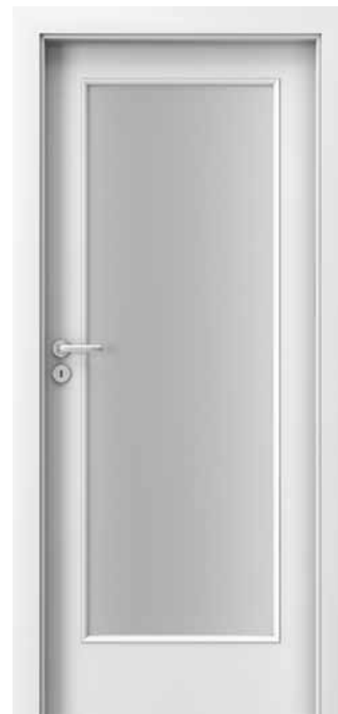
MODEL 1.4 Laminát CPL HQ 0,2