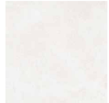
BETONICO bílošedá 60x60 rekt. Značka: Rako Kód zboží: DAK63790.1

Mrazuvzdorná a rektifikovaná dlažba v betonovém designu o rozměru 59,8x59,8 cm a tloušťce 10 mm s matným povrchem. Vhodné do interiéru i exteriéru. S velkými rozdíly v odstínu barev, struktury povrchu a kresby. Vysoce odolné proti opotřebení.