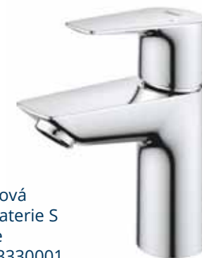
PRO Edge páková umyvadlová baterie S Značka: Grohe Kód zboží: G23330001