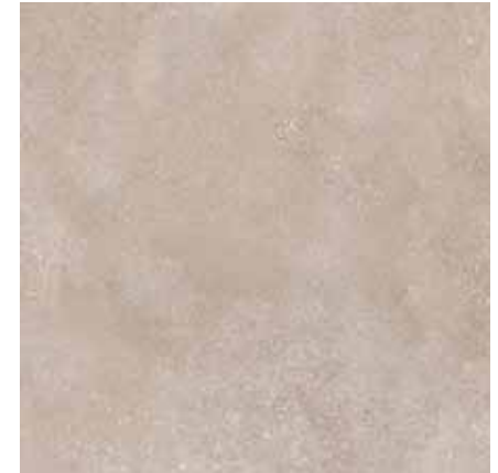
BETONICO tm.běžová 60x60 rekt. Značka: Rako Kód zboží: DAK63794.1