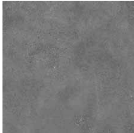
BETONICO černá 60x60 rekt. Značka: Rako Kód zboží: DAK63792.1