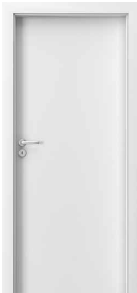
MODEL 1.1 Laminát CPL HQ 0,2

KOLEKCE Laminát CPL MODEL 1.1 DECOR sklo - matné