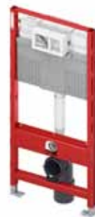
TECEprofil modul pro WC do sádrok. Značka: Tece Kód zboží: 9.300.302