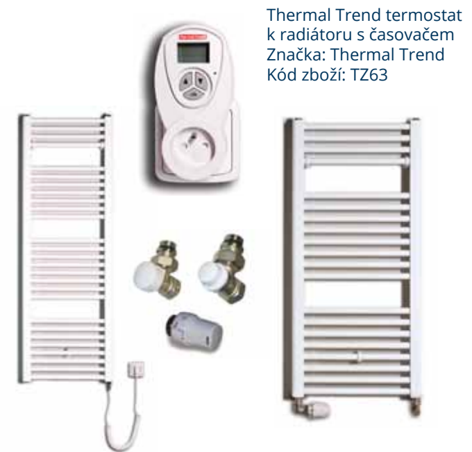
Radiátor elektrický Thermal Trend KE 96x45 cm bílá Značka: Thermal Trend Kód zboží: KE450960