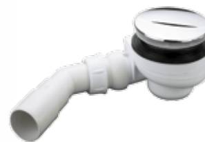
Vaničkový sifon 90mm Turboflow 54l/min Značka: Nicoll Kód zboží: ETURBO90