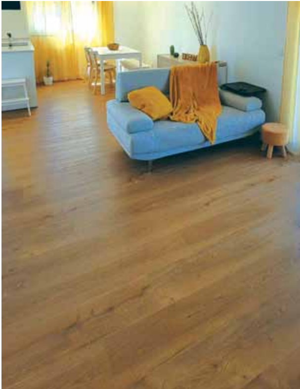
9573 Honey Mountain Oak Plovoucí vinilová podlaha