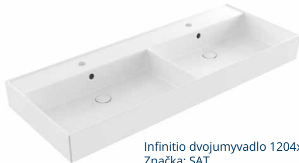
Infinitio dvojumyvadlo 1204x465x130 mm Značka: SAT Kód zboží: SATINF212046