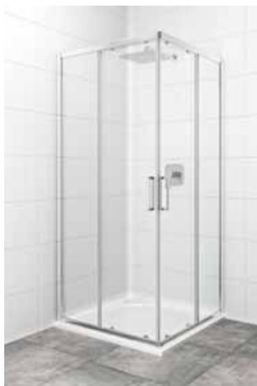
Sprch. kout čtverec- 90 CRT, bez madel Značka: SAT Kód zboží: SIKOTEXQ90CRT