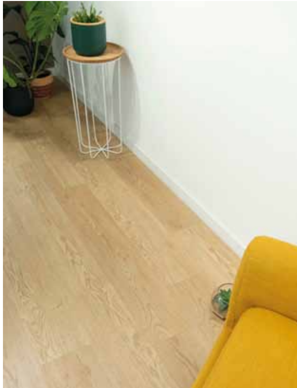
9581 Sand River Oak Plovoucí vinilová podlaha