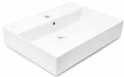
Infinitio umyvadlo 605x465x130 mm Značka: SAT Kód zboží: SATINF6046