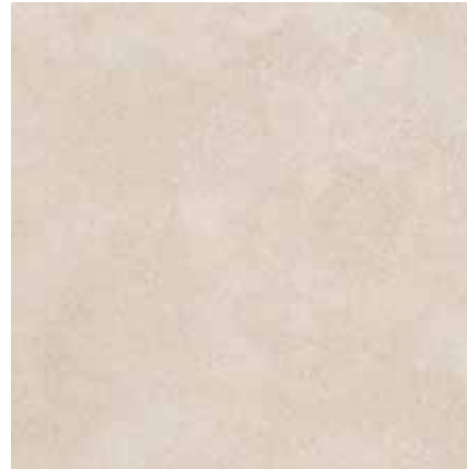
BETONICO sv.běžová 60x60 rekt. Značka: Rako Kód zboží: DAK63793.1